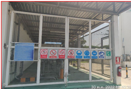
ป้ายเตือนความปลอดภัย