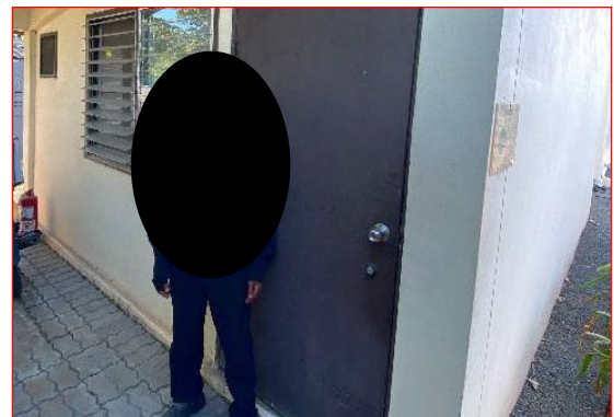
เจ้าหน้าที่รักษาความปลอดภัย

ภาพที่ 3.2-1 ภาพถ่ายระบบรักษาความปลอดภัยบริเวณสถานีก๊าซโครงการท่อส่งก๊าซธรรมชาติ ไปยังสถานีบริการ NGV ของสมาคมขนส่งทางบกแห่งประเทศไทย พื้นที่ อ.แก่งคอย จ.สระบุรี