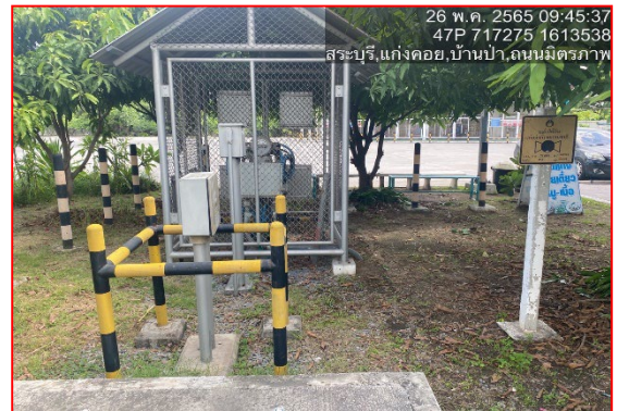
ป้ายเตือนแนวท่อส่งก๊าซฯ