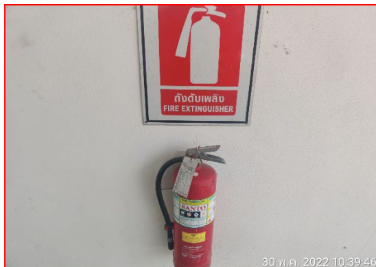
อุปกรณ์ดับเพลิง